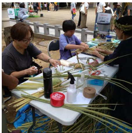
⑨生きものや環境にやさしいお米づくりを知ろう！ [NPO 法人かわごえ里山イニシアチブ]