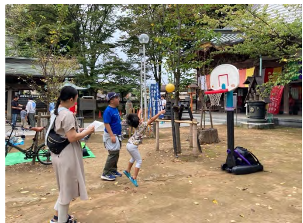
⑭みんなで楽しくカラダを動かそう！「バスケットゴールチャレンジ！」 [埼玉 YMCA]