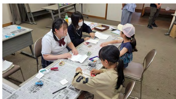
④リサイクルおもちゃ作りにちょうせんしょう！ [大宮国際中等教育学校 探究プロジェクトチーム]