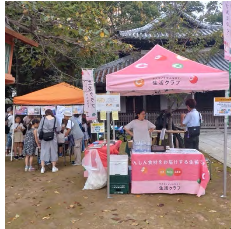
⑫こねこねせっけん作り / 環境家計簿～家族ではじめるSDGs！ [生活クラブ川越支部]