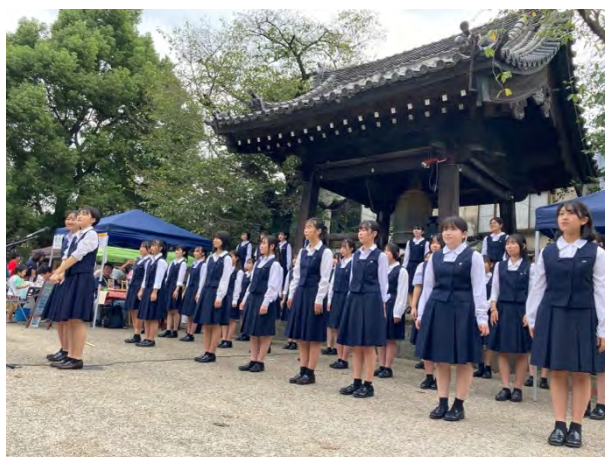
②川越女子高校音楽部による合唱