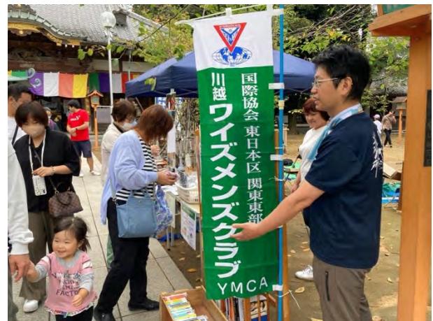
⑬高齢者疑似体験 / 「古書再読」～読み終わった本を次の人のもとに [川越ワイズメンズクラブ]