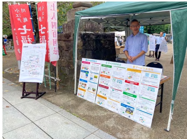
入口・受付の様子