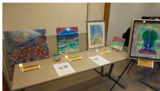
②宇宙からのおくりもの～ミュオグラフィアート展示 [ミュオグラフィアート埼玉拠点]