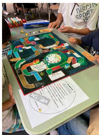
⑧フードパントリーで考える SDGs [川越子ども応援パントリー]