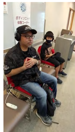
①紙スピーカー作り & ボディソニック体験 [パイオニア株式会社]