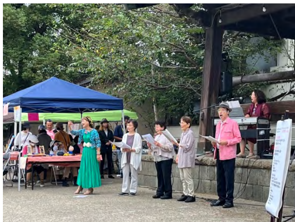
③SING カワゴエによるステージ「みんなで歌ってSDGsや川越の文化を発信」