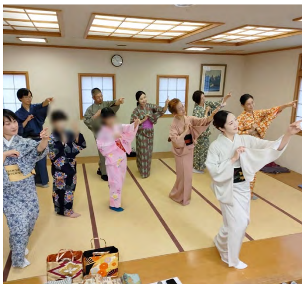
③キモノを着て和のしぐさを学ぼう！～お洋服の上からでOK～！ [帯バッグ/帯ベルトの小梅や]