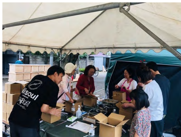
⑥世界にひとつだけの eco な my コンポストを作ろう！ [株式会社ニソール]