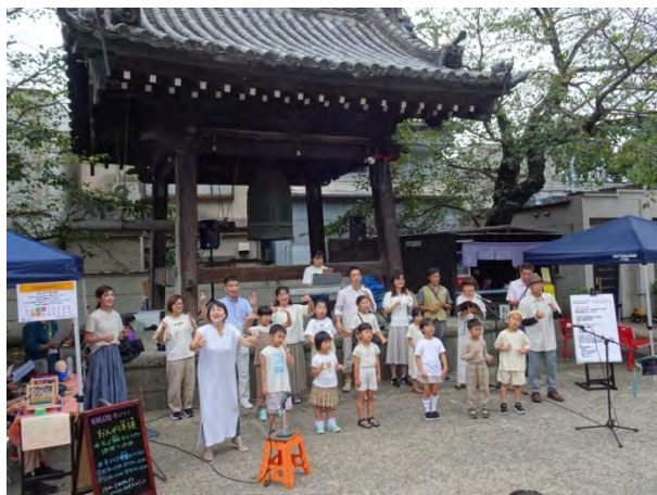
①まっきい&まっすう、たねまキッズによる手話と音楽パフォーマンス」