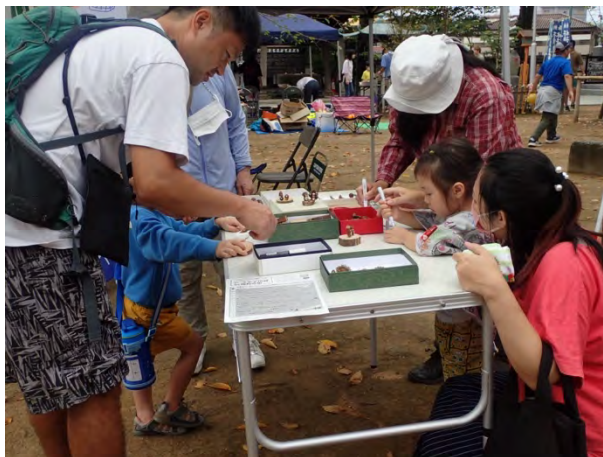
⑩森を守る活動を知ろう！「2023 森フェス in 川越」体験～丸太切り&どんぐりアート [かわごえ環境ネット]