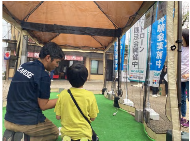
⑯さんきょうもっこうのドローン体験 [三共木工株式会社]