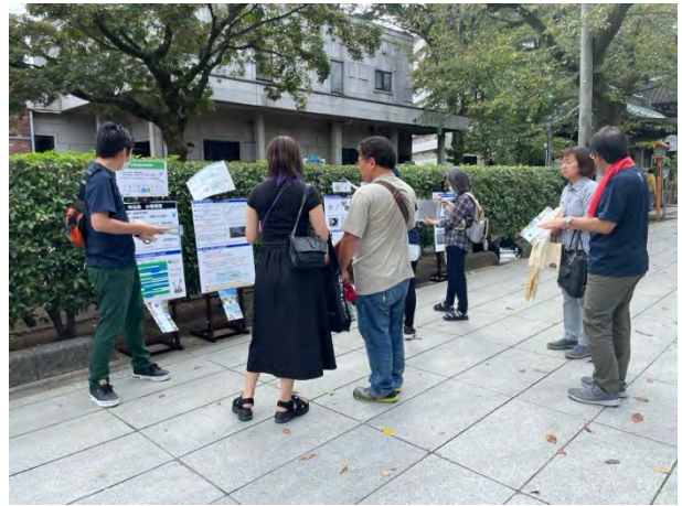
⑮パネル展示「埼玉県いきもの（魚類）調査」 [埼玉県水環境課]