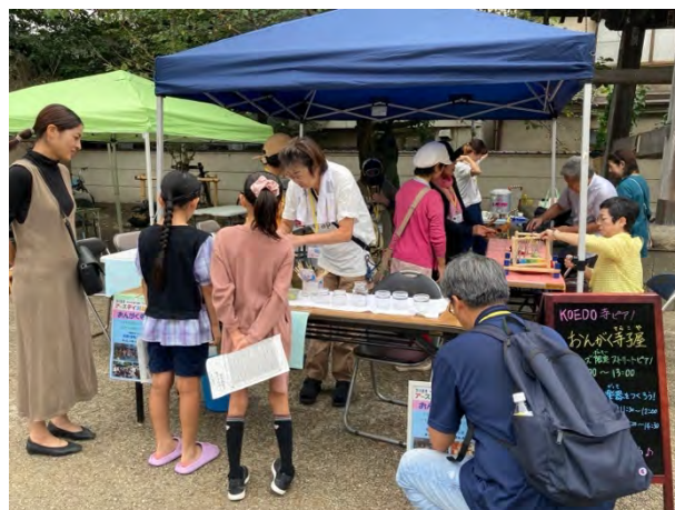
⑦おんがく寺子屋 [KOEDO 寺ピアノ]