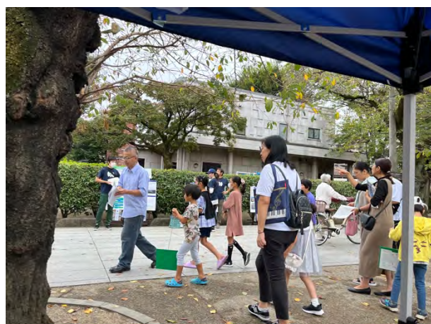
⑤親子で楽しむ「昭和の街ウォークラリー」 [東洋大学地域活性化研究所×仙波書房]