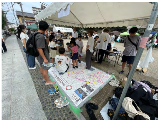
⑪川越 SDGs すごろく [中央公民館×芝浦工大]